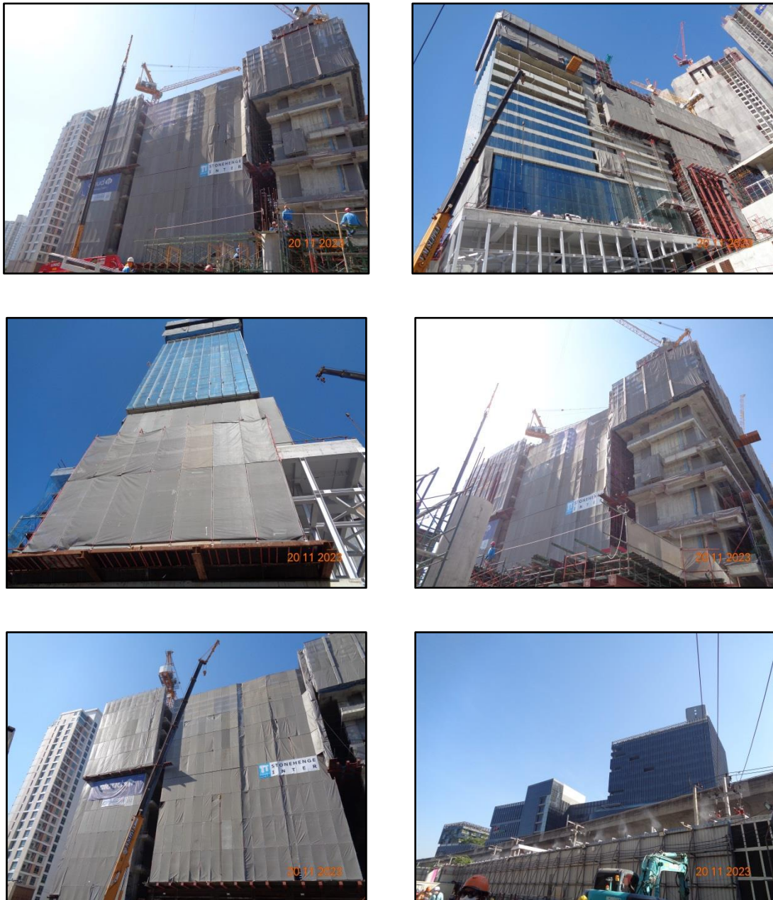
รูปที่ 1.3-1 สภาพปัจจุบันของโครงการ

ในช่วงก่อสร้าง โครงการได้รับแจ้งการก่อสร้าง คัดแปลง รื้อถอนอาคาร ตามมาตรา 39 ตริ (แบบ ขผ.4) ดังแสดงในภาคผนวก ก และภาคผนวก ข รูปที่ 1 เรียบร้อยแล้ว ซึ่งปัจจุบันโครงการ ได้ดำเนินการก่อสร้างไปแล้ว 39.35 % ดังแสดงในรูปที่ 1.3-1